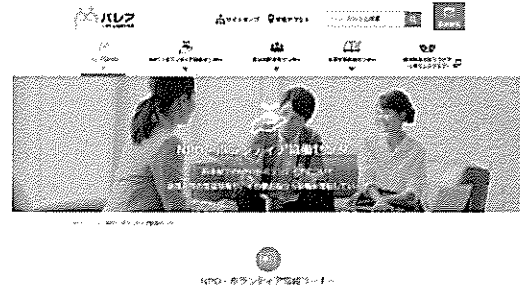
NPOボランティア協働センターのHP